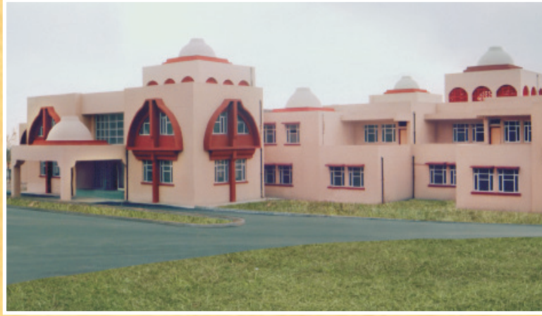
Shri Ranbir Campus, Jammu